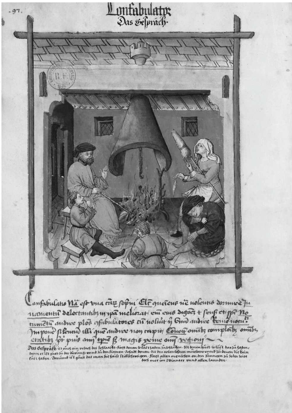
Confabulator (conversation) Tacuinum Sanitatis , 14. yy. Tıp, İtalya